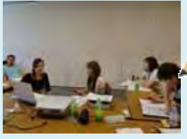
真剣に打ち合わせしています (注：ヤラセではないですよ)