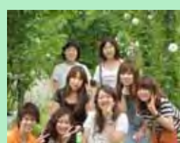
ハーブ園で、はいチーズ！