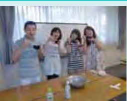
そばの味はまいち・・・