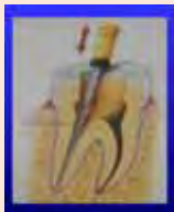
根のそうじをする

神経が細菌に侵されると、炎症が起きて痛みが出るため、神経を取り除く必要があります。この処置により、ほとんどの痛みがおさまるため、治療を中断してしまう方が多いですが、神経を取った後は、歯の根っこの中をきれいに掃除して、細菌の侵入を防ぐために、ペースト状の薬をつめて、蓋をする必要があります。神経を取って痛みが治まっても、そのまま放置すれば、新たに細菌が入り込んで炎症が広範囲に広がるため、痛みが出ます。そのため根っこの治療の間は、痛みがなくてもきちんと通院していただくことをお勧めします。