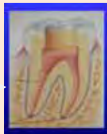
根に薬をつめた状態